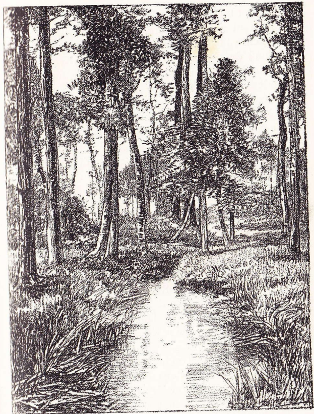
Le Ruisseau à Pede-Sainte-Anne.

A la bifurcation, prenons la droite et passons à côté d'une grande ferme ; franchissons le pont de